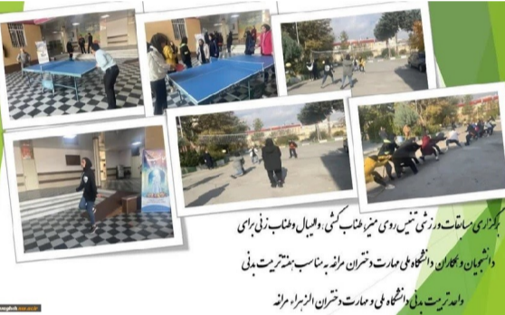
برگزاری مسابقات ورزشی تیر، دو، طنز، کشتی، و میمال و تنیس برای دانشجویان و همکاران دانشگاه ملی مهارت مراغه به مناسبت هفته تربیت بدنی و در ترمینال دانشگاهی و مخابراتی در ترمینال الزهراء مراغه